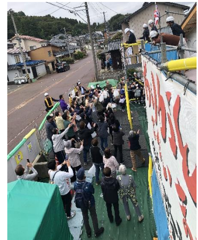
【餅まきの様子です】