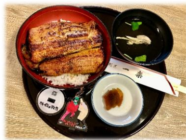
【みんなでいただいた鰻重です！】