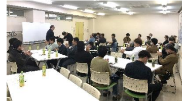
【業者勉強会の様子】

皆さんが前向きに取り組む姿勢は、私たちにとって大変喜ばしいことです。この勉強会を通じて、安全に、そしてお客様や近隣の皆様に喜んでいただける仕事ができることを願って、これからも続けてまいります。