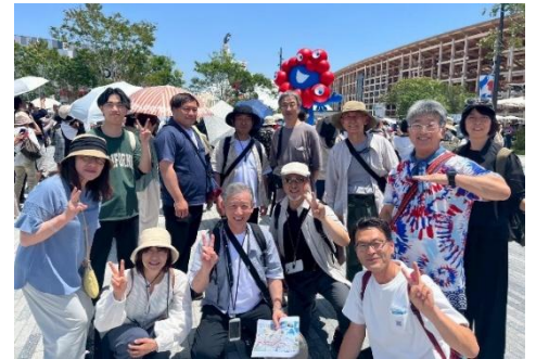
大阪・関西万博へ社員旅行！