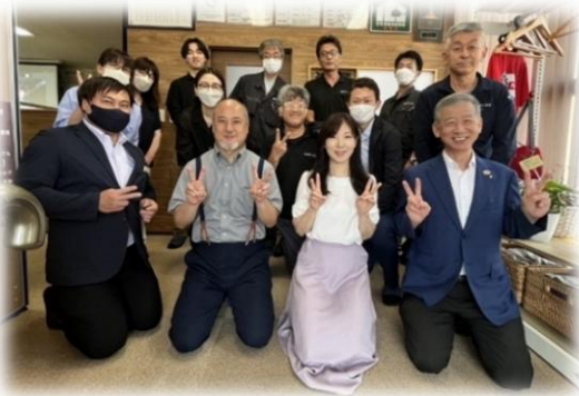
「伝え方セミナー」林講師と一緒に！