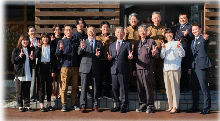
【事務所前での集合写真】